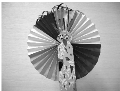
ラップの芯を使って作った「羽根をひらくクジャク」