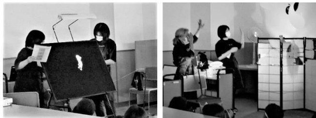
(左)珍しいブラックパネルシアターの様子

図書館閉館後の薄暗い中、当日多くの親子連れの方に参加頂きました。普段の読み聞かせとは違い絵本をプロジェクターで壁に投影したり、ブラックパネルシアターも登場。