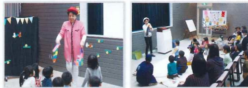
手品の腕前はプロ級で、子どもたちはもちろん大人にも大人気

日高さんの話 親子そろって楽しんでいただけるように心がけています。お孫さんを連れての高齢の方や、また障害のある方にも喜んでもらえることも考えています。