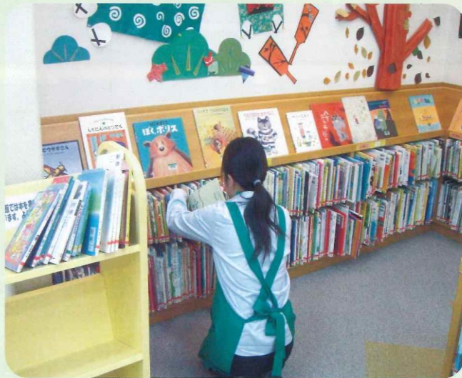
返却本を排架する窓口業務ボランティア (子ども図書館)