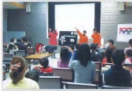
パネルシアター(土曜シアター)