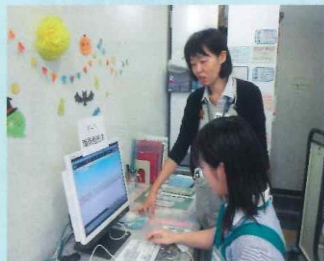
コーディネーターから研修を受けるボランティア