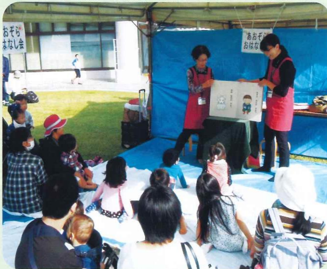
あおぞらおはなし会で読み聞かせをする 行事・イベントボランティア (市立図書館前ふれあい広場)