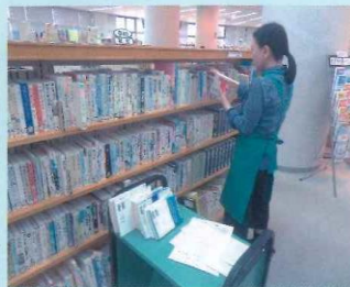
書架から予約本を抜き取りするボランティア