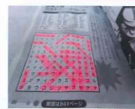
〈クロスワードへの落書き〉

借りた本が破れていたり、ページが外れていたりしたときは、セロテープなどで貼ったりせずに、そのまま返却してください。返却時に、本の状態を教えてください。