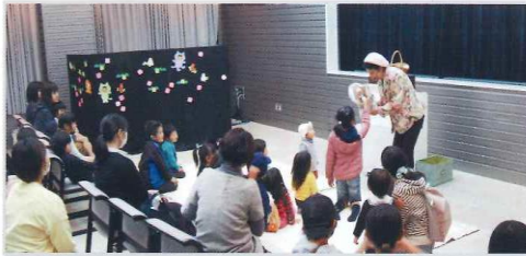
人形を使っての腹話術(土曜シアター)

平成12年から土曜シアターをはじめ、市立図書館での活動を続けています。腹話術、マジックショー、あやつり人形、獅子舞い、玉すだれなどレパートリーは広く、特にマジックは毎月のようにプロのベテランを県外から呼んで教習を受けるほど力を入れています。マジックの道具は8割くらい自作しています。市立図書館での活動のほか、公立公民館でマジック教室の講師を務めたり、依頼を受けて県内各所に出向いて公演したりなど元気いっぱい活動をしています。