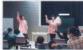
手づくりの道具を使ってのクイズ 遊びは子どもたちに人気