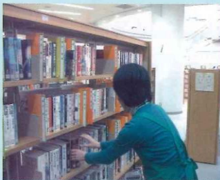
一般コーナーで書架整理するボランティア