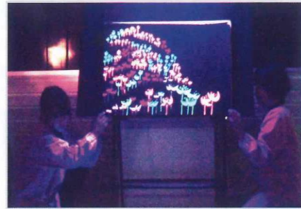
ブラックシアター(部屋を暗くし、黒い舞台で蛍光塗料の絵などをライトアップ)の上演

県庁のすぐ近くにある橘保育園に勤務する保育士の有志でチームをつくり、20年前から市立図書館の土曜シアターで活動しています。普段から手遊び、絵本の読み聞かせ、パネルシアター、ペープサート、エプロンシアター、折り紙、ブラックシアターなど多くの出し物を準備していて、これらを組み合わせたプログラムは多彩で、子どもたちをはじめ大人にも人気です。保育園内に留まらない市立図書館での活動は、図書館利用の子どもたち、市民の皆さんを楽しませると同時に、チーム自身にとってもいい体験になっています。