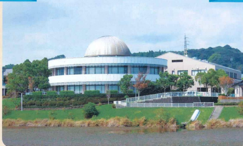
宮崎市立図書館 東側から