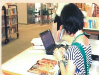
雑誌・週刊誌の入れ替えを行う 窓口業務ボランティア