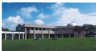
宮崎市立図書館 南側の広場から