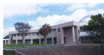
宮崎市立図書館 南東側から