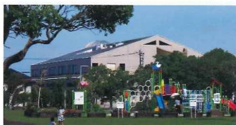
宮崎市立図書館 西側の公園から