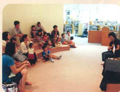
おはなし会で読み聞かせを行う 行事・イベントボランティア